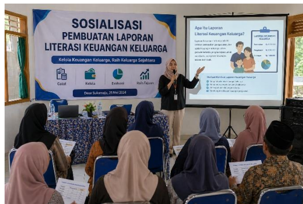
Gambar 1 Kegiatan Workshop Literasi Keuangan Keluarga

Peserta diberikan pelatihan mengenai pencatatan pemasukan dan pengeluaran, serta pentingnya pemisahan keuangan pribadi dan usaha. Literasi keuangan menjadi fondasi penting dalam pengambilan keputusan ekonomi keluarga yang rasional (Meita Sekar Sari & Muhammad Zefri, 2019).