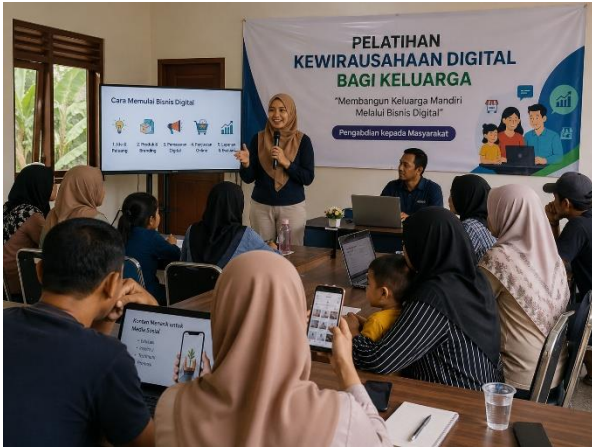
Gambar 2 Kegiatan Pelatihan Kewirausahaan Digital Keluarga