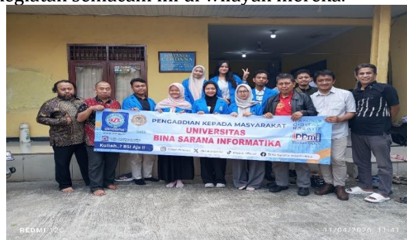
Gambar 5 Foto Bersama Anggota PM Universitas Bina Sarana Informatika

Secara keseluruhan, tahap monitoring dan evaluasi menunjukkan bahwa program pengabdian masyarakat ini berjalan efektif dan memberikan dampak positif bagi peningkatan kapasitas kader PKK Cendana Bekasi. Pendekatan partisipatif yang digunakan terbukti mampu meningkatkan pemahaman, keterampilan, serta motivasi peserta dalam mengelola keuangan dan mengembangkan usaha berbasis digital secara berkelanjutan. Sehingga peserta mememinta kembali untuk diadakan kegiatan semacam ini di wilayah mereka.