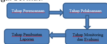
Gambar 1. Tahapan PkM

Penyusunan laporan akhir PkM merupakan tahap terakhir yang mana pada tahap ini tim PkM menyusun seluruh kegiatan yang telah dilaksanakan dalam bentuk laporan akhir. Setelah tersusun laporan akhir tim PkM juga menyusun draf artikel yang dipublikasikan pada jurnal Nasional. Adapun bagan alur tahapan PkM, sebagai berikut: