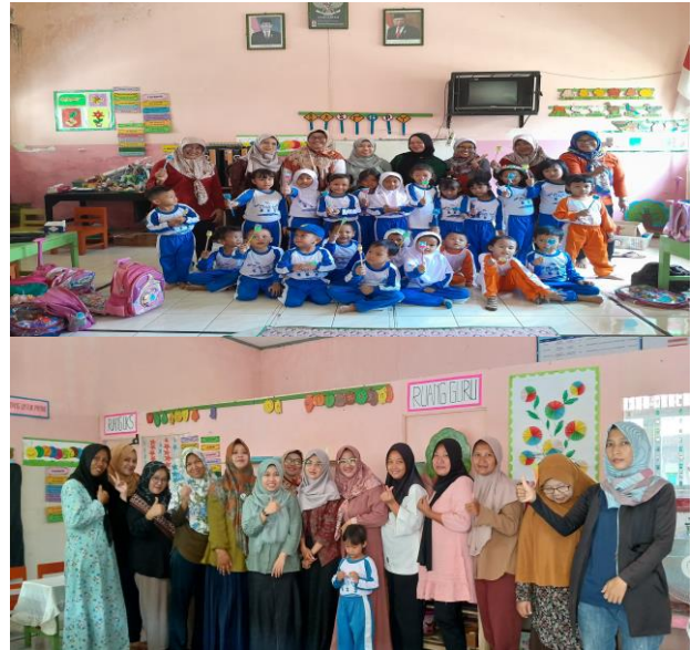
Gambar 3. Kegiatan PKM

Mitra terlibat aktif dalam penyuluhan dan antusia melakukan diskusi interaktif dengan Tim PkM, berbagai permasalahan mitra disampaikan secara terbuka untuk kemudian dicarikan solusi bersama. Hasil yang dicapai setelah mitra mengikuti kegiatan PkM yaitu meningkatnya pengetahuan dan kesadaran mitra akan pentingnya edukasi pencegahan bullying sejak usia dini di POS PAUD ANANDA Desa Sokaraja Kidul, Kecamatan Sokaraja, Kabupaten Banyumas. Adapun target ketercapaian program disajikan pada bagan dibawah ini: