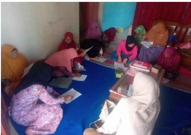
Gambar 1. Peserta mengerjakan soal pre-test

Setelah melaksanakan pembukaan, peserta mengerjakan soal pre-test yang disebar dalam bentuk kertas. Pre-test merupakan salah satu tes yang diberikan sebelum pelatihan dimulai yang bertujuan untuk mengetahui penguasaan peserta terhadap bahan yang akan disampaikan (Yuwono, 2021). Pre test dilakukan dengan memberikan lembar soal yang berisi sepuluh pertanyaan yang harus dijawab dengan jujur oleh peserta penyuluhan.