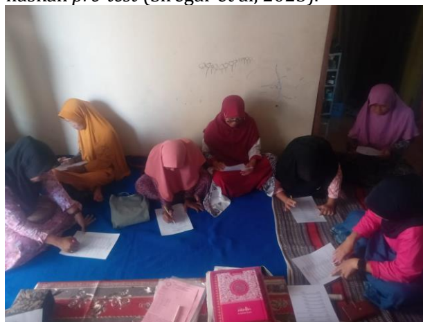
Gambar 3. Peserta mengerjakan post-test.

Para peserta kemudian diminta untuk kembali mengerjakan lembar soal sebagai posttest . Posttest dilaksanakan untuk mengetahui pemahaman para peserta penyuluhan terhadap materi yang telah diberikan. Fungsi utamanya adalah untuk menentukan apakah tujuan-tujuan yang telah dirumuskan sebelumnya telah tercapai atau belum. Materi post-test ini tentang urban farming yang merupakan materi utama, kemudian naskah posttest dibuat sama dengan naskah pre-test (Siregar et al, 2023).