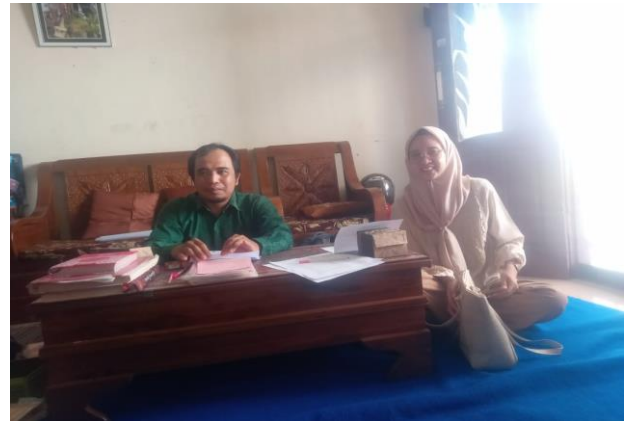
Gambar 2. Tim menyampaikan materi

ketahanan pangan keluarga. Tujuan pengabdian dilaksanakan untuk menjaga kecukupan gizi anggota keluarga, mengurangi pengeluaran dan meningkatkan stabilitas ekonomi. Upaya untuk menjaga ketahanan pangan keluarga untuk masyarakat perkotaan adalah dengan urban farming . Urban farming merupakan strategi peningkatan akses pangan di wilayah perkotaan (Anggrayni et al., 2015).