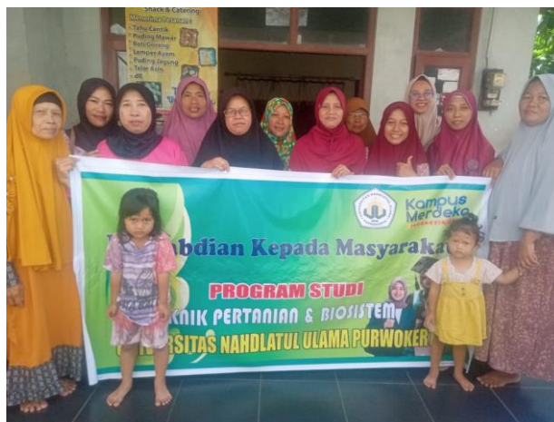
Gambar 4. Peserta Berfoto Bersama Setelah Acara Selesai

Setelah seluruh rangkaian acara kegiatan Pengabdian Kepada Masyarakat selesai, maka kegiatan pun ditutup. Sebelum pulang, peserta diminta untuk foto bersama sebagai dokumentasi, sebagaimana terlihat pada Gambar 4.